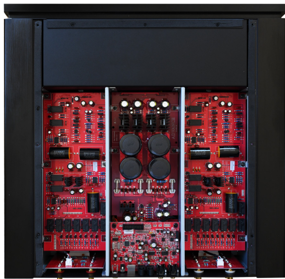
Compartmentalized design, ultra-rigid frame and components selected for optimum results.

will be associated with the X-A1200 mono unit for an exceptional hifi system.