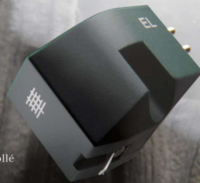
Bas niveau Diamant Elliptique collé