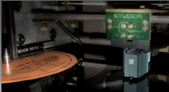
HANA/EL, installed in STUDER/REVOX, "B795" LINATRACK Turntable system, a vintage in 1970s.

Excel Sound Corporation a développé la gamme de cellules à bobine mobile MC HANA en combinant une expérience de 50 années de savoir-faire et une parfaite maîtrise des technologies et de la manufacture de cellules phonoelectriques ; un savant mélange de matériaux de haute qualité et d'expertise dans la conception et les techniques d'assemblage, pour un résultat irréprochable.