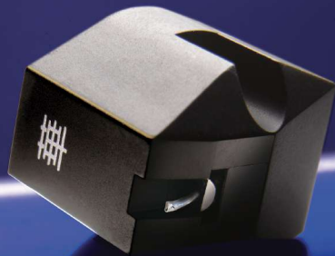
Haut niveau Diamant Shibata Intégral