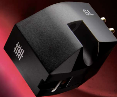
Bas niveau Diamant Shibata Intégral

Le générateur, une fois assemblé manuellement par les artisans qualifiés composant la force vive de Excel Sound, est intégré à une coque en plastique ABS.