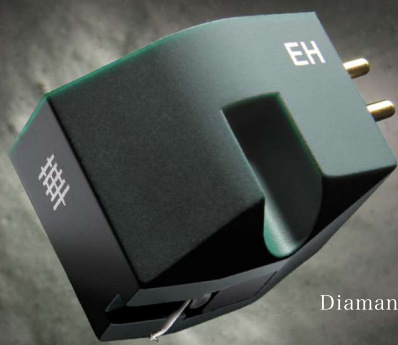
Haut niveau Diamant Elliptique collé